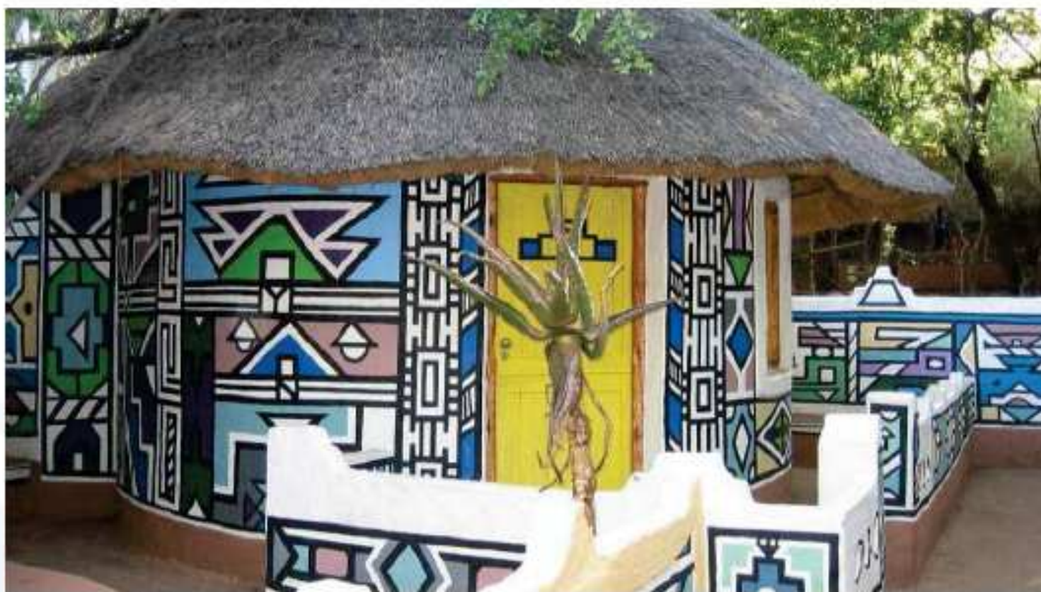
Village de Ndébélé