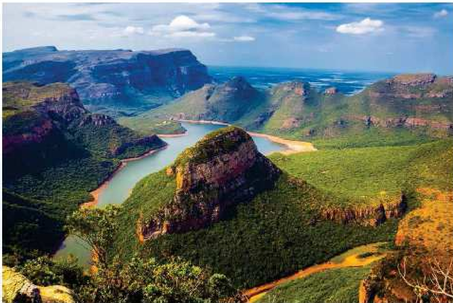
Canyon Blyde River

Vous vous arrêterez sur votre route au point de vue de Three Rondavel. Vous surplombez le magnifique lac artificiel.